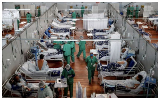
The second wave of the pandemic in Brazil hit young people particularly hard, as the picture of many patients under 40 in hospital in Santo André, Brazil, shows.