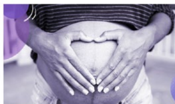
© Ministério da Saúde indicou todas as gestantes e puérperas entre as grupos prioritários do Plano Nacional de Operacionalização da Vacinação contra a Covid-19. Foto: happy

29/04/2021 - 09:50 | ATUALIZADO EM: 29/04/2021 - 17:00